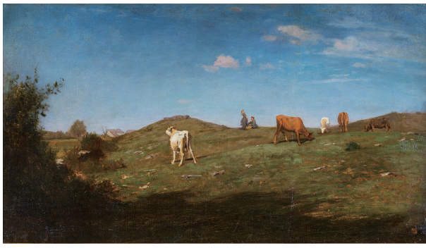
1.《ブジェイ高原》1859-1860年 油彩/画布 40.5×72.5cm 2.《ベルグ湖岸》1855年頃 石版 15.1cm×21.7cm 3.《雲》1880年 油彩/画布 200×301cm 4.《フィレンツェの旧市場》1867年頃 油彩/画布 92×69.5cm 5.《物思いにふける羊飼》1861-1863年 油彩/板 27.8 × 38.1cm 6.浅井忠《徳川家の聖廟I(寺の入り口I)》1878年頃 油彩/紙 32.6×25.2cm 1~5 アントニオ・フォンタネージ 1~6すべて トリノ市立近現代美術館 GAM-Turin Civic Gallery of Modern and Contemporary Art.