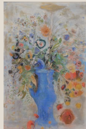
オディロン・ルドン 《グラン・ブーケ(大きな花束)》1901年

建物と同時代の19世紀末西洋美術を中心に、アンリ・ド・トゥールーズ=ロートレック、オディロン・ルドン、フェリックス・ヴァロトン作品等を収蔵しています。