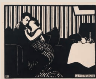
フェリックス・ヴァロトン 《『アンティミテ』I.嘘》1897年