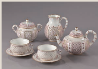
デイヴィーコレクション 《竹に透かし彫りティーセット》1862-76年