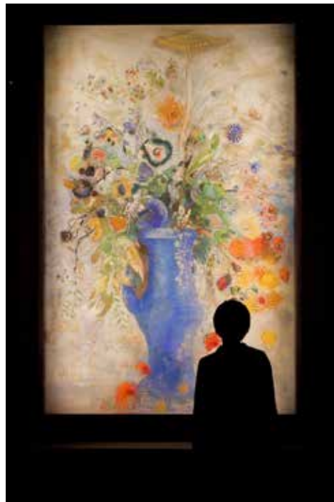
オディロン・ルドン《グラン・ブーケ(大きな花束)》 1901年、パステル/カンヴァス、248.3×162.9cm 「三菱一号館美術館 名品選2013」でご覧いただけます。

高橋 先ほど当館所蔵のオディロン・ルドン《グラン・ブーケ(大きな花束)》をご覧いただきましたが、いかがでしたか？ 横原 まさしく三菱地所さんの宝ですね。美しいだけでなく、圧倒されるような力がある。素晴らしいのひと言です。