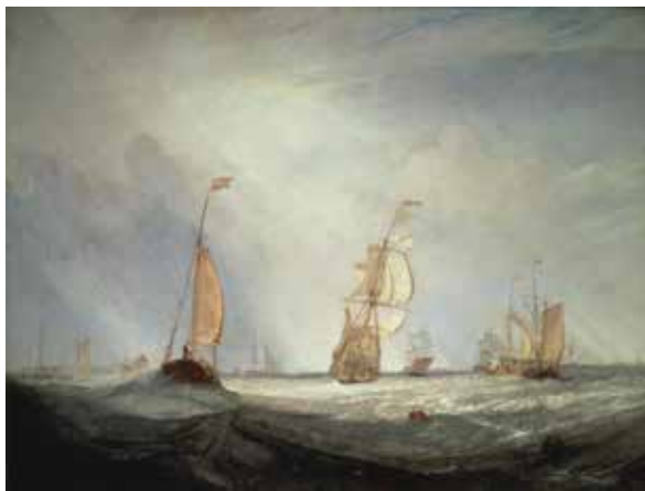
J.M.W.ターナー 《ヘレヴーツリユイスから出航するユトレヒトシティ64号》 1832年、油彩/カンヴァス、91.4×122.0cm、東京富士美術館蔵