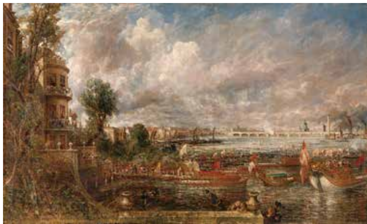
ジョン・コンスタブル 《ウォータールー橋の開通式(ホワイトホールの階段、1817年6月18日)》 1832年発表、油彩/カンヴァス、130.8×218.0cm、テート美術館蔵