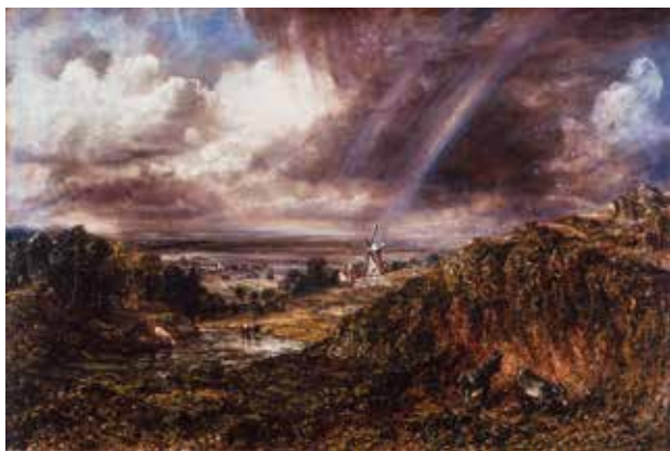
ジョン・コンスタブル 《虹が立つハムステッド・ヒース》 1836年、油彩/カンヴァス、50.8×76.2cm、テート美術館蔵