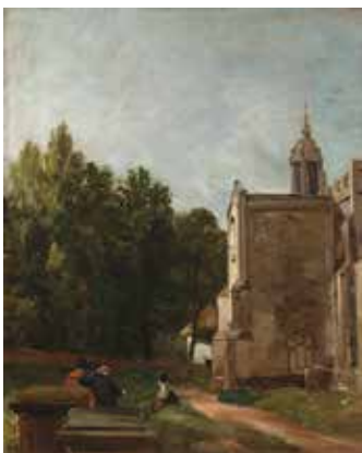
ジョン・コンスタブル 《教会の入口、イースト・バーゴルト》 1810年発表、油彩/カンヴァス、44.5×35.9cm、テート美術館蔵

日本では 35年ぶり となる本回顧展では、世界有数の良質なコンスタブルの作品群を収蔵する テート美術館 から、ロイヤル・アカデミー展で発表された大型の風景画や再評価の進む肖像画などの油彩画、水彩画、素描 およそ40点 にくわえて、同時代の画家の作品20点あまりをご紹介します。国内で所蔵される秀作を含む全85点を通じて、ひたむきな探求の末にコンスタブルが豊かに実らせた 輝々しい風景画 の世界を展覧します。